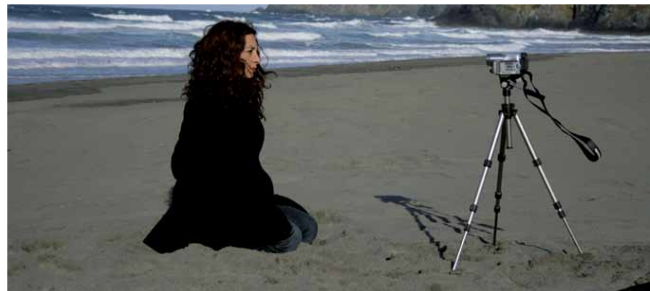
Sara Malinarich Apnea. Territorio Mar-intimo , (2008) Video instalación interactiva